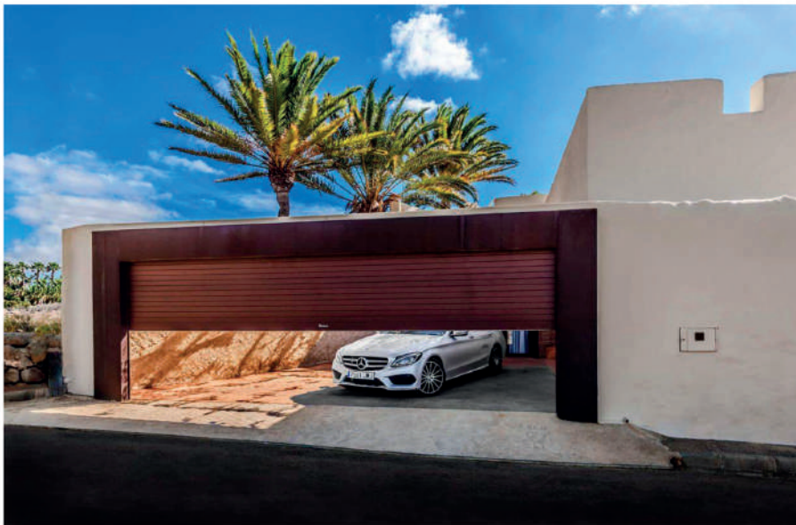
DIAMOND BL X-TREME. VIVIENDA PRIVADA