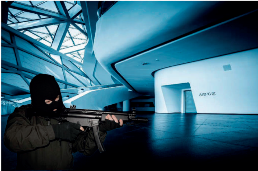
DIAMOND BL X-TREME. CENTRO NEURÁLGICO

Alta seguridad para su vivienda, local, bunker, habitación del pánico u otros emplazamientos de seguridad, permitiendo ser cerrada a través de los sistemas de seguridad que más le interese dada su completa capacidad de integración con cualquier dispositivo electrónico además de disponer de una amplia gama de acabados que permiten integrar este modelo de puerta, persiana o cortina en cualquier ambiente decorativo.