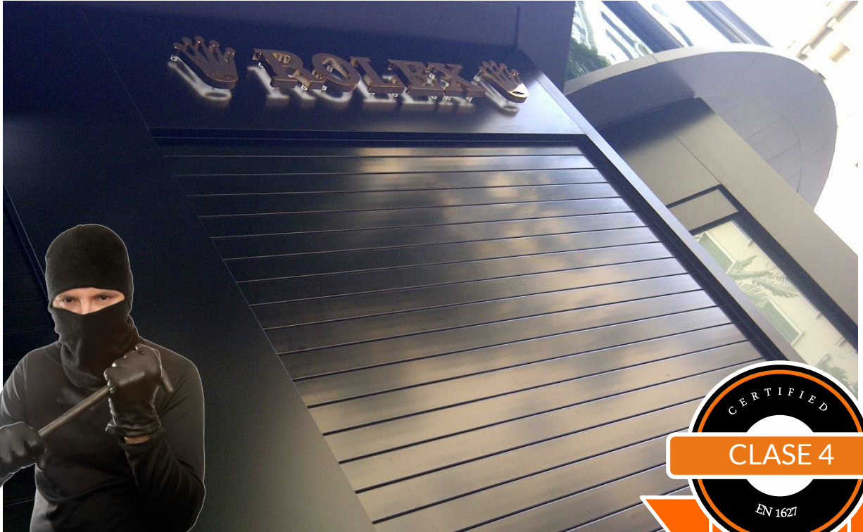
Mod. SECURBAIX BL en Anodizado Plata Brillo