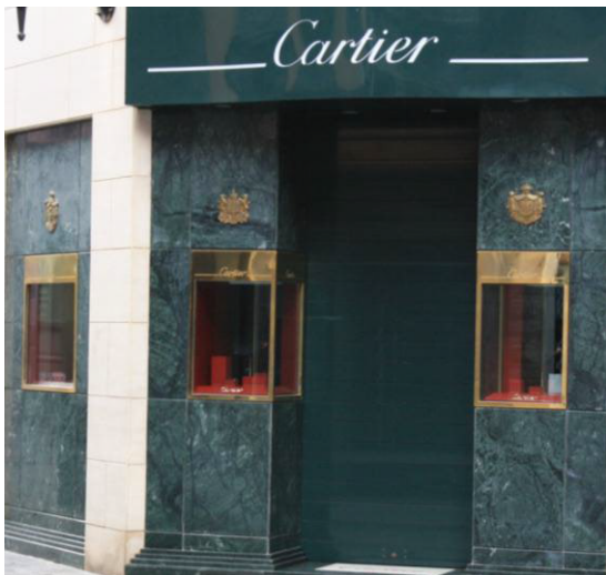
Mod. SECURBAIX BL en Ral 6009